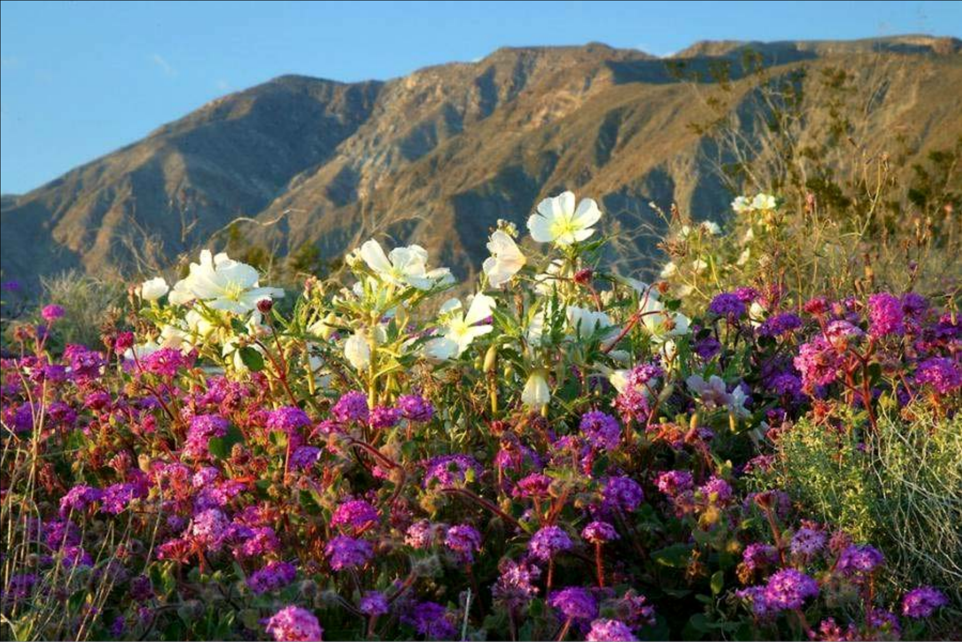
Des fleurs de toutes les couleurs apparaissent surtout près de la côte, formant un beau tapis multicolore.